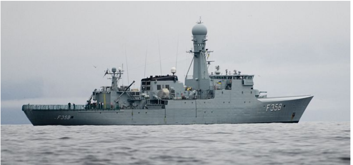
Frégate HDMS Triton F358 de la Marine Royale Danoise