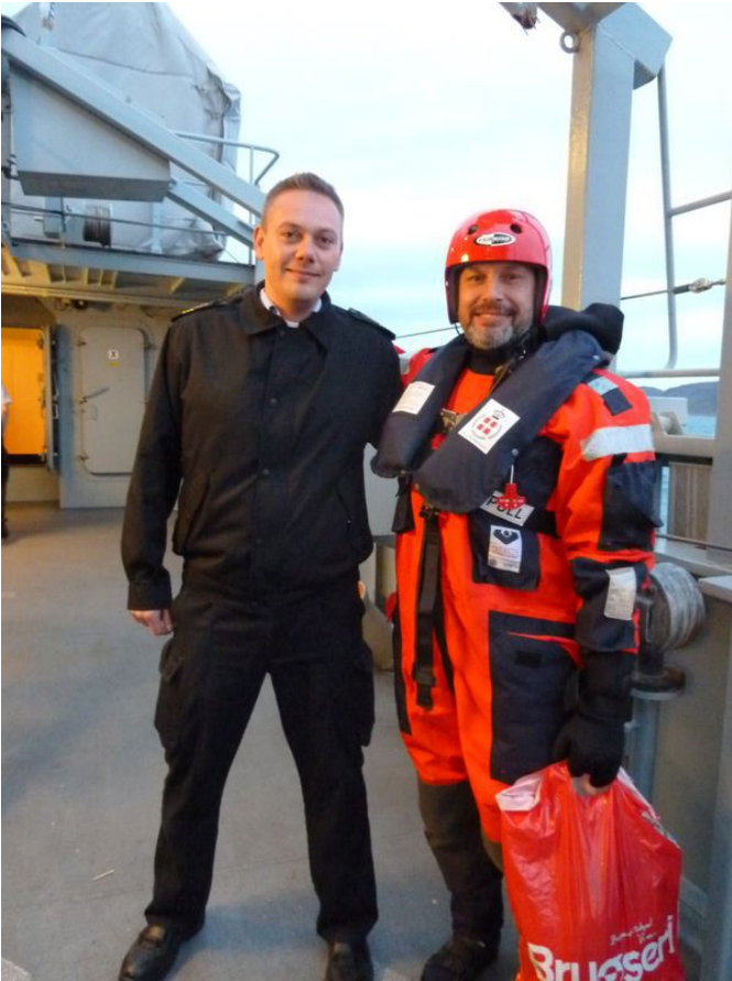
Di!ier et /"a0% $é!e&in