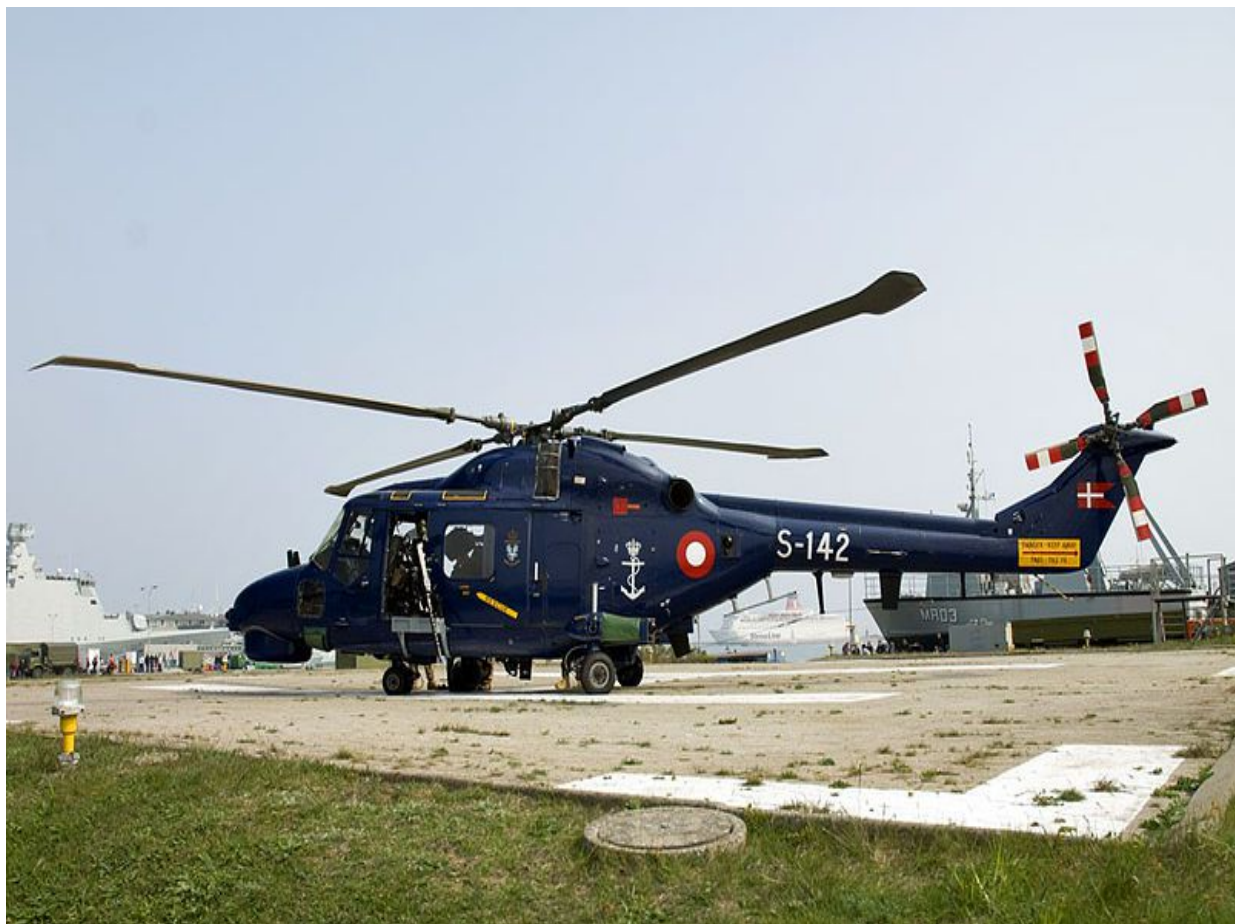
Hélicoptère Sikorsky S-142 de la Marine Royale Danoise